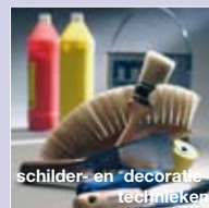
schilders- en decoratieve technieken